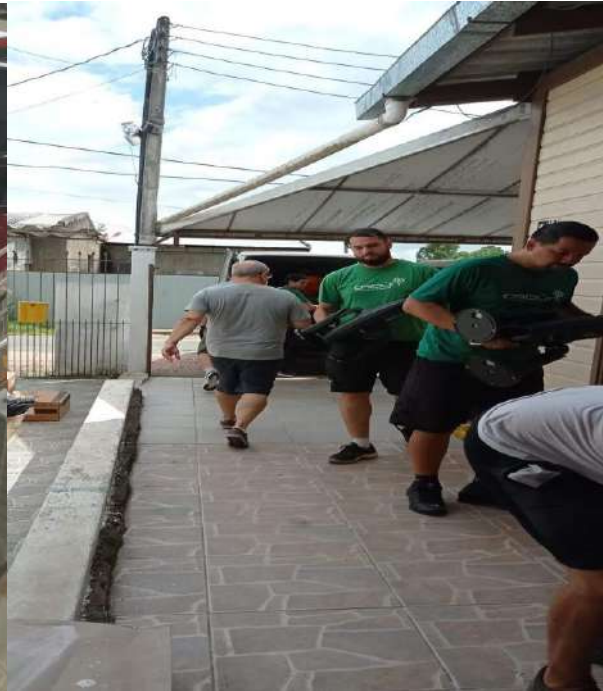
Foto nº08 Máquinas Recebidas