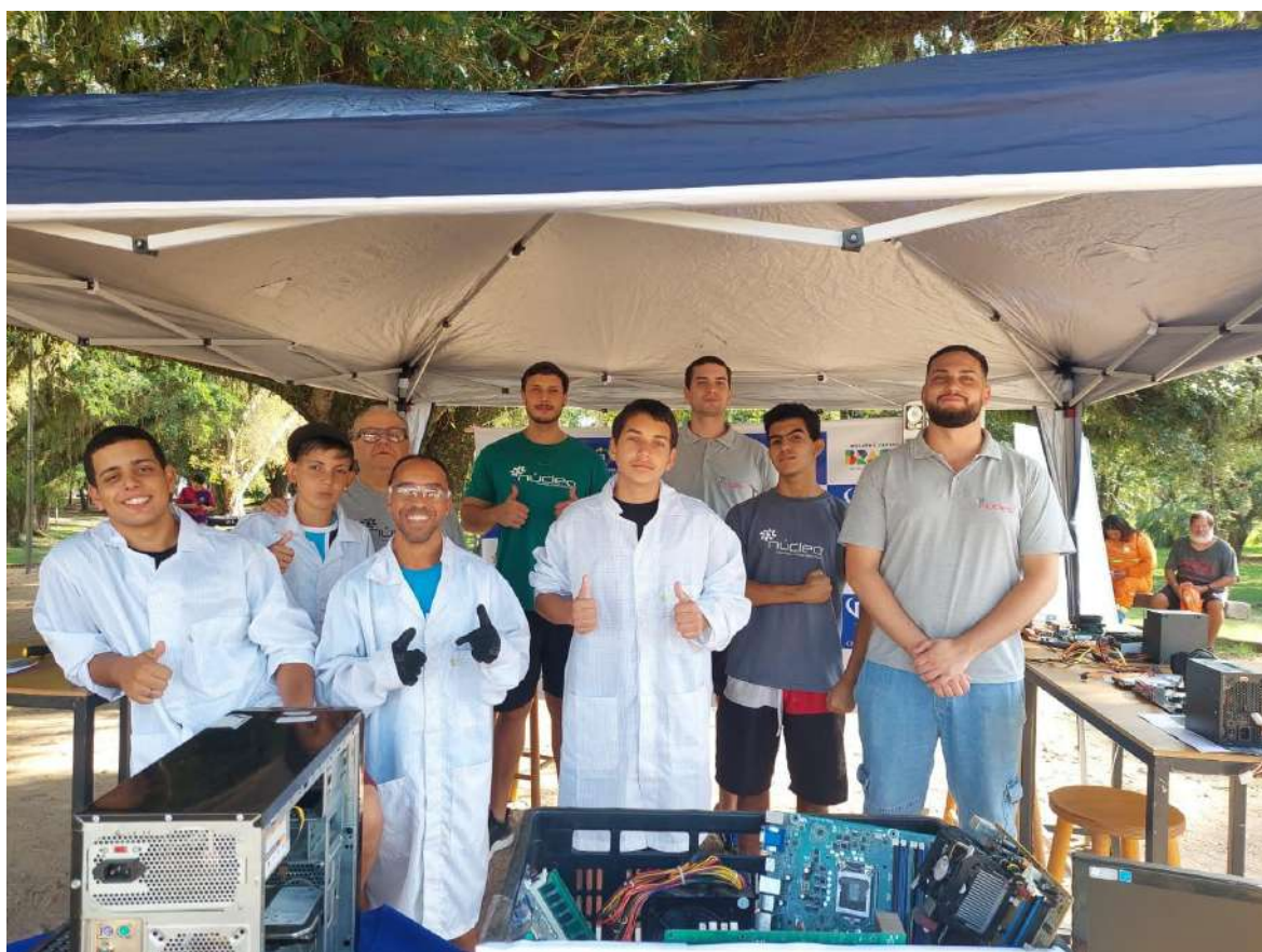
Foto nº 04 – CRC NCC Belém Novo Presente no evento do Dia Nacional da Inclusão Digital , realizado em 27 de Março de 2024.