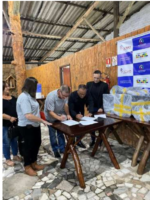
Foto nº 11 Entrega das Doações ao Museu da Cultura HIP HOP RS