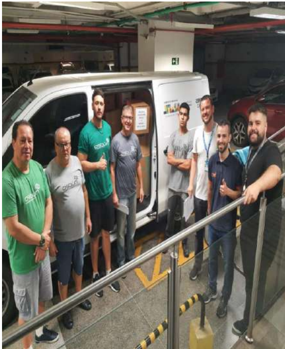
Foto nº 07- Chegada de doações