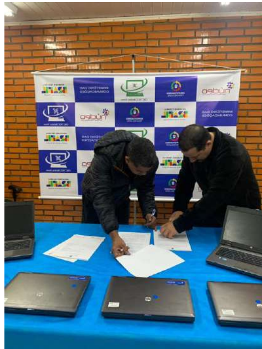
Fotos nº 13e 14 Aulas Inaugural de Informática Básica e Montagem e manutenção de Computadores